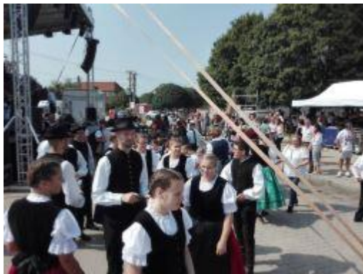
a felvonulás előtti pillanatok

A Disznótoros Kolbászfesztivál a vidéket hozza el Budapestre egy hétvégére, október 12-14-ig. 3 napon át tart majd az óriási kolbászvásár, ahol 250 féle háztáji kolbászból lehet válogatni. Az ország minden pontjáról érkeznek kolbászkészítők, sőt még a