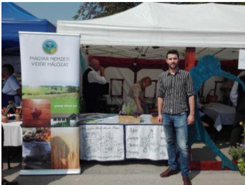
MNVH a Hartyánfesztén

forrásokat és a szabadidejükkel nem fukarkodva szerveznek. Sok sikert kívánunk a további munkához!