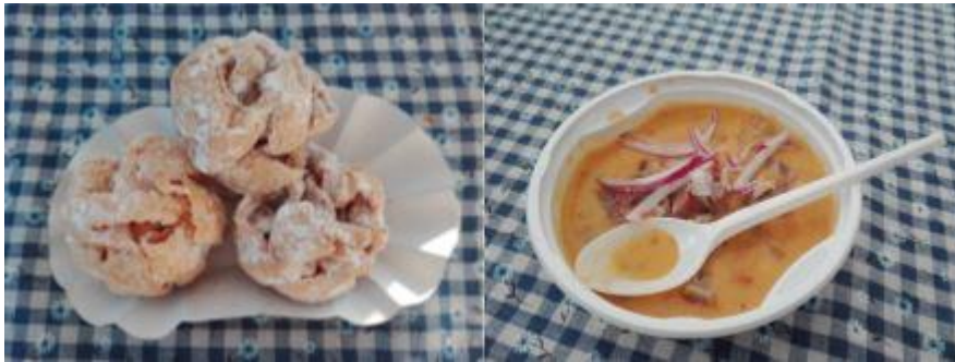
„labdarózsa” sütemény és savanyúbab