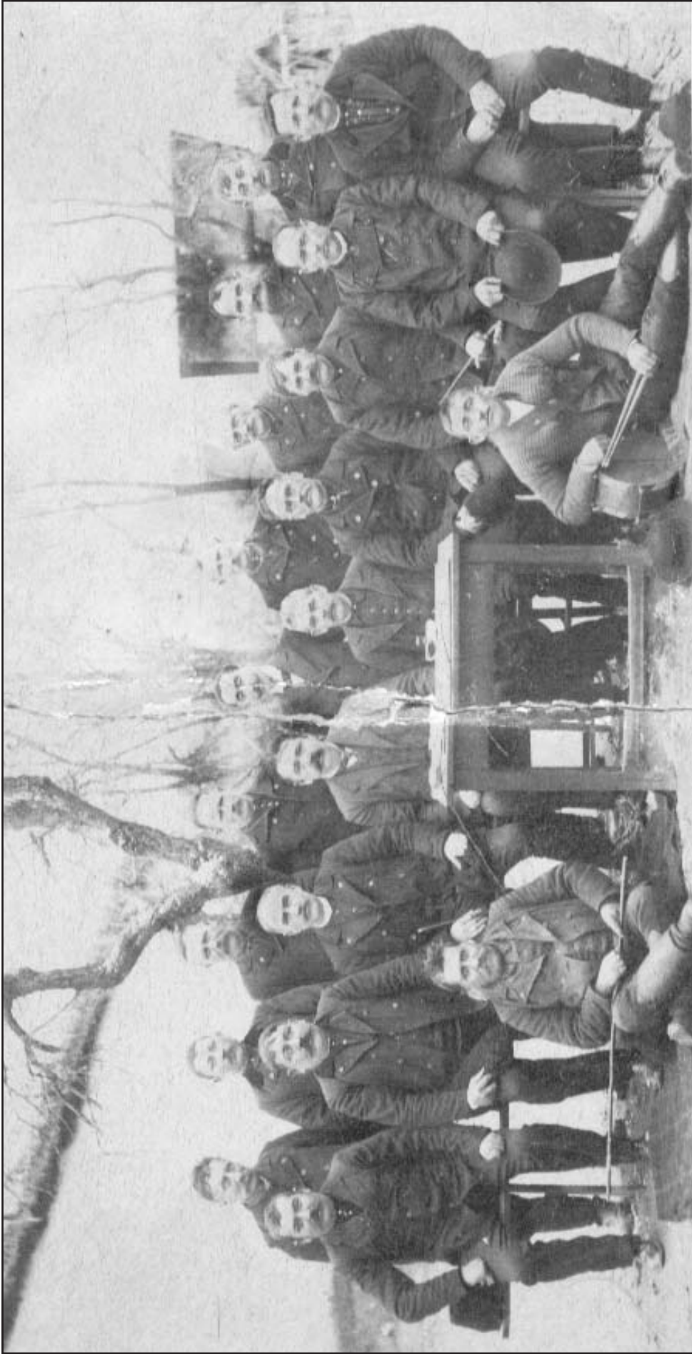
Ú J H A R T Y Á N. község elöljárósága a XX.sz. fordulóján